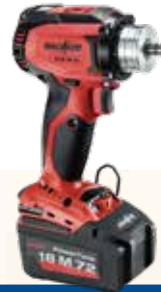
A18 M bi