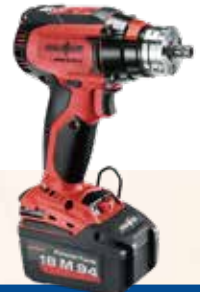
ASB18 M bi